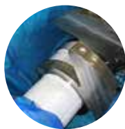
Emisores y Desecantes