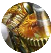
Aceites Preventivos y Grasas