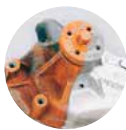
Limpiadores y Desengrasantes